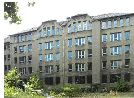
Die Hoffassade vor der Sanierung