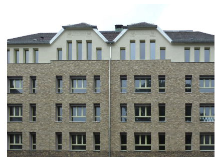
Die gleiche Fassade zum Projektabschluss