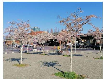
Der neue Stadtplatz an der Treppe hinunter zur Spree