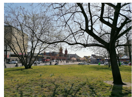
Blick vom Pocketpark auf die Oberbaumbrücke