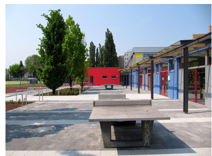
Der kleine Außenbereich des Familienzentrums mit Zugang zum Sportplatz