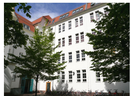
Der denkmalgerecht sanierte Innenhof