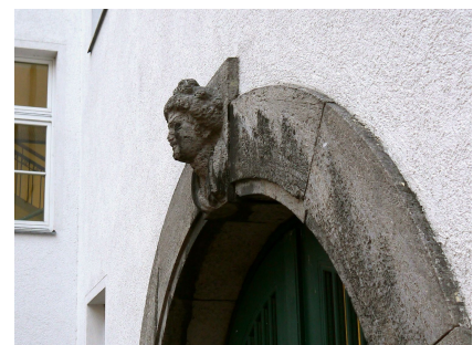
Mädchenkopf des Bildhauers Joseph Rauch