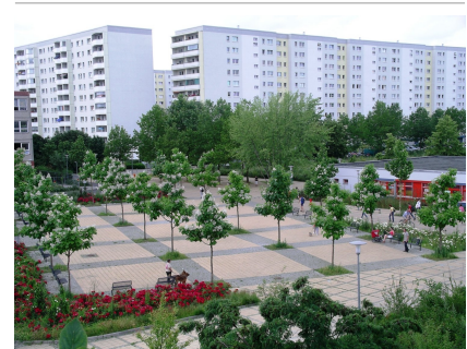
Blick auf den westlichen Bahnhofsvorplatz