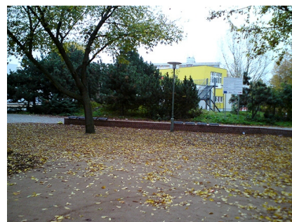
Herbststimmung am erneuerten Stadtplatz