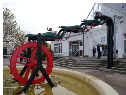
Die Brunnenkunstwerk wurde überarbeitet