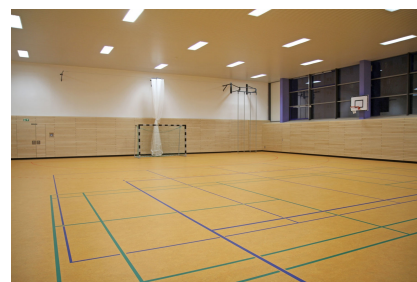
Die Kiezsporthalle verfügt nun über einen elastischen Boden und umlaufenden Prallschutz