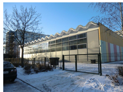
Die Welsehalle mit neuer Aluglasfassade