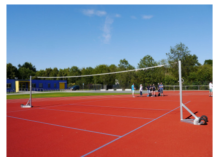
Auch Volleyball und Beachvolleyball sind möglich