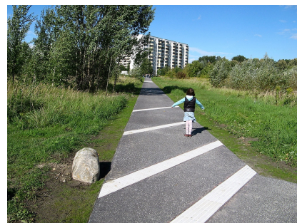
Der Asphaltweg mit Entschleunigungsstreifen