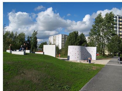
Blick auf die Boulderwände am Zugang Vincent-van-Gogh-Straße