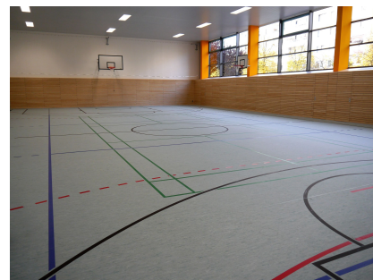
Der neue Innenraum