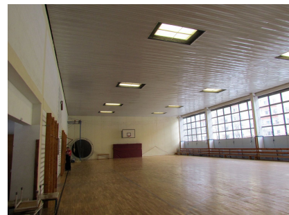
Der Innenraum vor der Sanierung