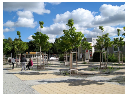
Sitzplätze unter Trompetenbäumen