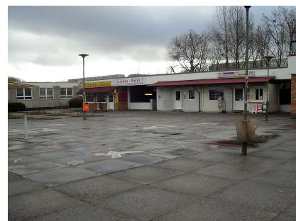
Der Bahnhofsvorplatz vor der Umgestaltung