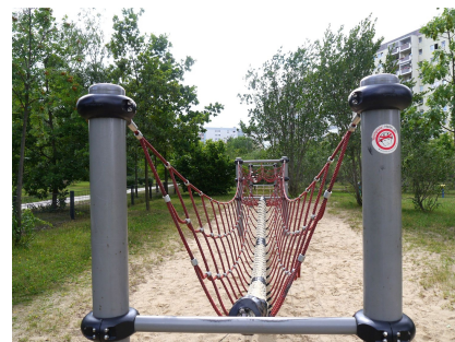
Anspruchsvoller Kletter- und Balancierparcour im Grünen