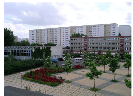
Das frühere Schulgebäude am Bahnhof Wartenberg vor dem Umbau