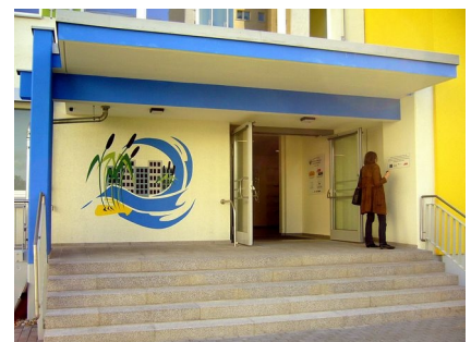
Der Eingang des Nachbarschaftshauses