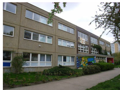
Das Gebäude vor der energetischen Sanierung