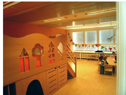
Im Krugwiesenhof gibt es auch eine Kita

Kita: 2011 bis 2012 Umbau und energetische Sanierung: 2004 bis 2008