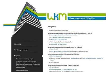
Die Website - wichtiges Kommunikationsmittel für das Kiezmanagement