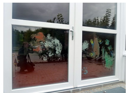
Der Eingang der Kita "Schneckenhausen"

192.000 EUR, davon 142.000 EUR aus dem Programm Stadtumbau Ost, jeweils inkl. Mittel der EU (EFRE)