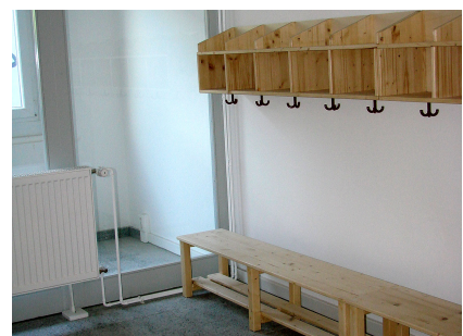
Garderobe für die Kita-Kinder