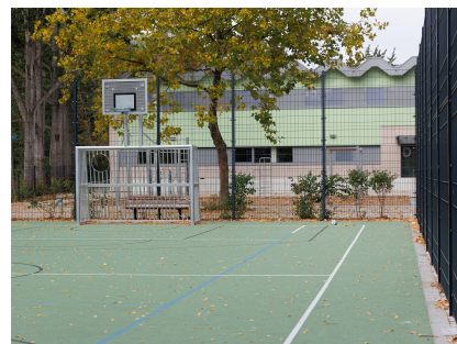
Einer von mehreren neuen Ballspielplätzen