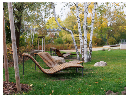
Ein Ort zum Entspannen im Birkenhain