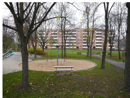
Eine neue Parkanlage mit interessanten Spielflächen ist entstanden