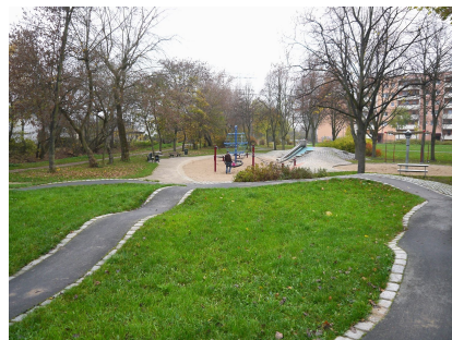
Die BMX-Bahn liegt erhöht über dem Spielplatz