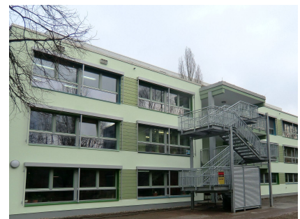
An der Rückseite wurde eine Außentreppe als 2. Fluchtweg angebaut