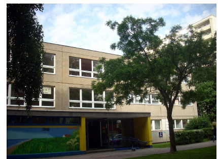
Das Gebäude vor Projektbeginn