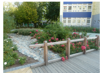
Der Bachlauf wird von Rosen und Gräsern gesäumt