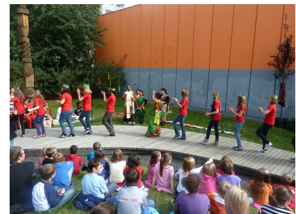
Zur Einweihungsfeier diente der Steg als Bühne