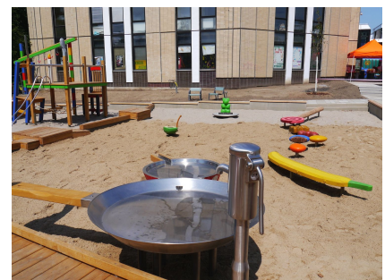
Das Wasserspiel ist vom barrierefreien Holzsteg beispielbar