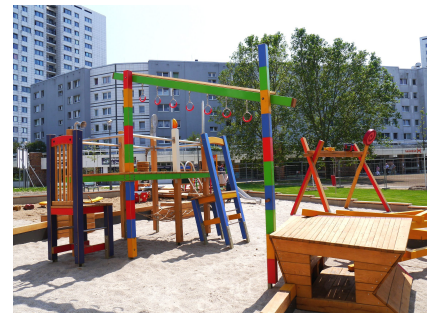
Überdimensionaler Essplatz zum Klettern und Pommestüte zum Verstecken