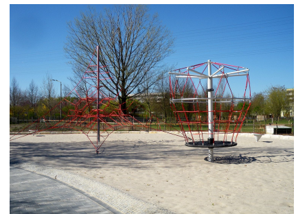
Die neuen, anspruchsvollen Klettergeräte am Oschatzer Ring