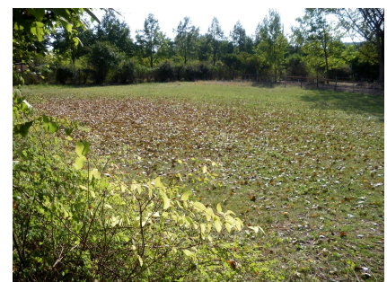
Die Fläche vor der Neugestaltung 2014