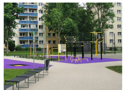
Auch eine Calisthenics-Anlage gehört zur neuen Ausstattung