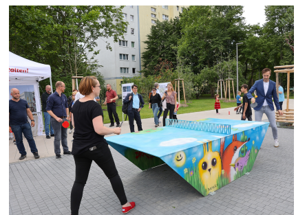
Die Tischtennisplatten wurden von Kindern und Jugendlichen zusammen mit einem Künstler gestaltet