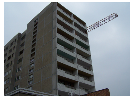
Teilrückbau des Elf-Geschossers im März 2006