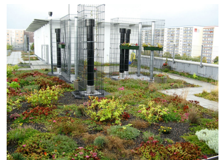
Der Dachgarten bietet eine grandiose Aussicht