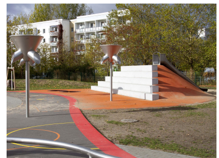
Tribüne mit Hangrutsche auf der Rückseite