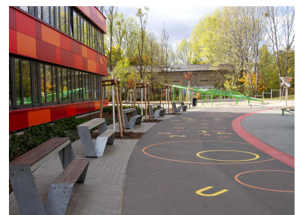
Der rahmende Asphaltweg ist mit Zahlen, Buchstaben und geometrischen Figuren gestaltet