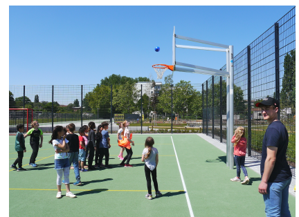
Der große Ballspielplatz mit zwei Fußballtoren und vier Basketballkörben