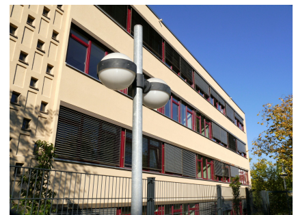
Die Musikschule wurde energetisch saniert