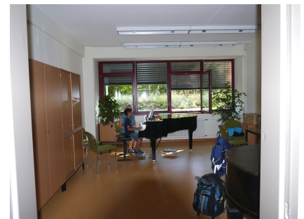
Durch die neuen großen Fenster ist Unterricht auch im Souterrain möglich