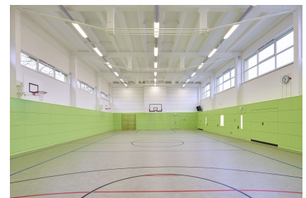
Die sanierte Sporthalle der Mozart-Gemeinschaftsschule, Foto: André Baschlawow