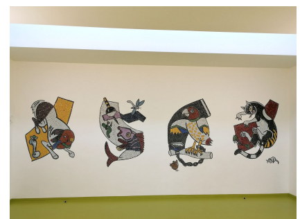
Vier Kunstwerke von Achim Kircher im Foyer werden durch ein Oberlicht inszeniert