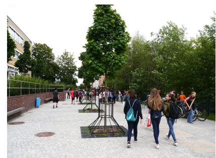
Ein großzügiger Vorplatz für das Gymnasium