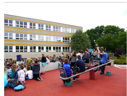
Das "Fliegende Klassenzimmer" bietet neben Spiel und Sport auch viel Überblick