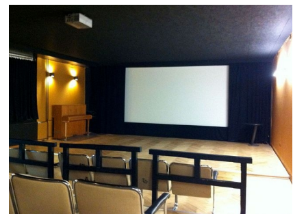
Der Kinosaal mit schallschluckender Decke und Wänden