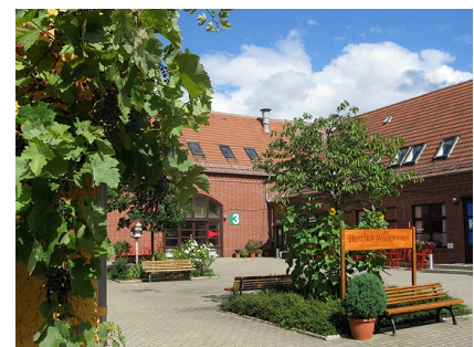
Blick in den Innenhof des KulturGuts