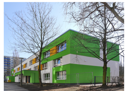
Die sanierte Kita am Murtzaner Ring