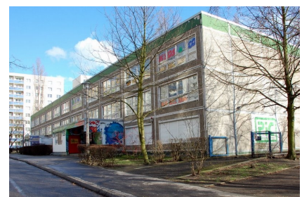
Das Haus vor der energetischen Sanierung