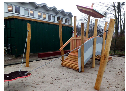
Der Bereich für die Kleinkinder