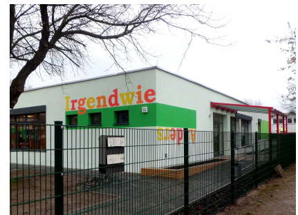
Die Kita an der Flämingsstraße nach der Sanierung