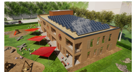
Perspektive des Neubaus