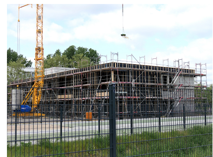
Die Baustelle im Mai 2023