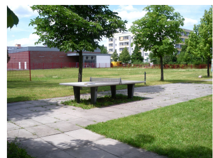
Die Freifläche gehörte früher zu einer Schule