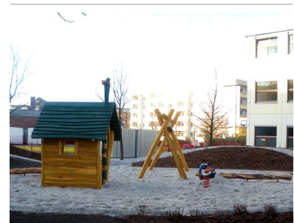
Die Spielfläche für die Kleinkinder