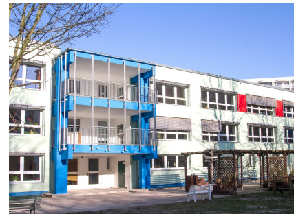
Die sanierte Fassade auf der Gartenseite mit Loggien