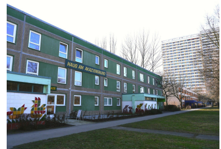
Das Kinder-, Jugend- und Familienzentrum vor der Fassadensanierung