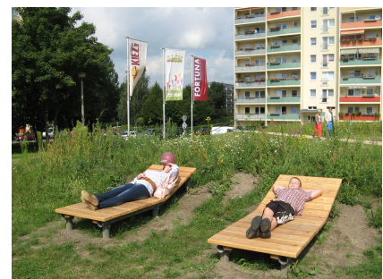
Auch Platz zum Ausruhen ist reichlich vorhanden