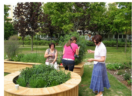
Hier darf gekostet werden - ein Kräuterhochbeet