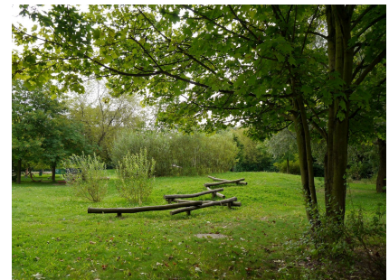
Ein ruhiger, naturnaher Bereich