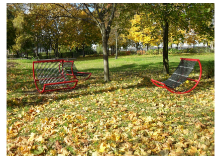
Sitzen oder Schaukeln, allein oder mit Freunden - alles ist hier möglich