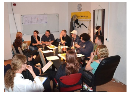
Jurysitzung. Jedes Teilnehmende Projekt entsandte jeweils ein Mitglied