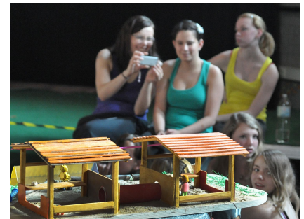
Sorgfältig erarbeitete Modelle waren im Wettbewerb oft wichtig