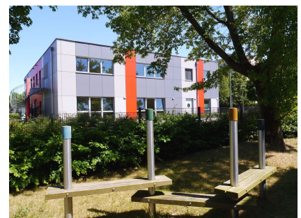
Neue Balancierstrecke oder Sitzbank, je nach Bedarf