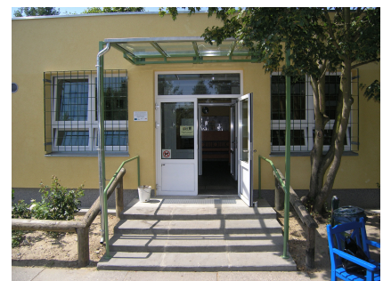
Der sanierte Eingang des Jugendtreffs "Senfte 10"