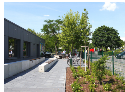
Der Eingangsbereich mit Sitzstufen und neu gepflanztem Bäumen