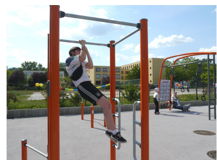
Geschicklichkeit und Kraft können sportbetont oder spielerisch trainiert werden