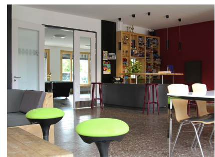
Lebendige Farben, viel Platz und zweckmäßige Einrichtung