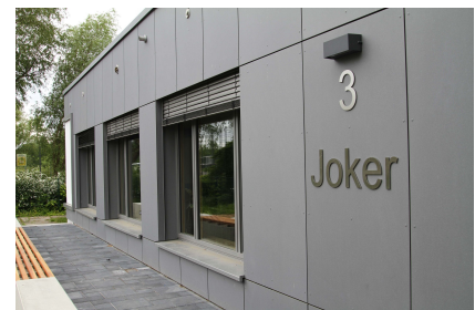
Der Jugendclub mit neuer Fassade