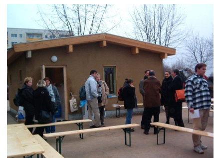
Feier zur Fertigstellung des Gemeinschaftshauses