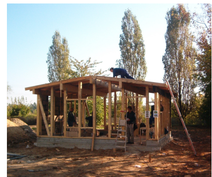
Die Ökoloabe im Bau