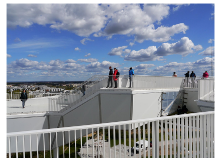
Von hier oben kann man bei klarem Wetter bis zu 50 Kilometer weit sehen