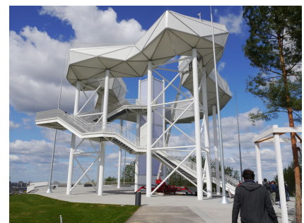
Das filigrane Bauwerk auf dem Kienberggipfel