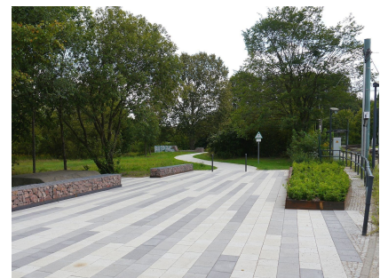
Der nördliche Zugang zum Wiesenpark an der Landsberger Allee