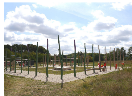
Der Spielplatz Wiesentraum