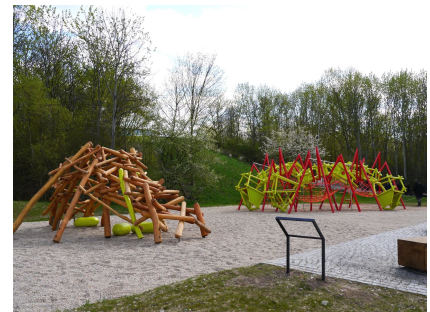
Blick über den Spielplatz auf dem Kienberg