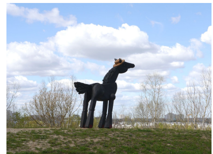
Das Pferd Negro Kaballo aus der Buchvorlage