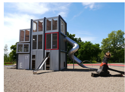
Der neue Spielplatz "Konrad in Elektropolis"