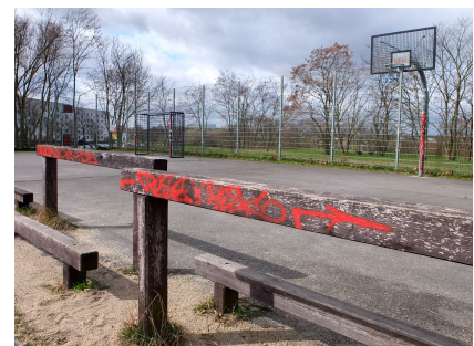
Der alte Ballspielplatz