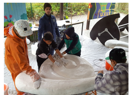
Wir können es selbst - die Kids vom "Joker" bei der Arbeit