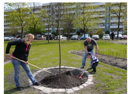
Pflanzfest 2016 - eine Familie pflanzt ihren Baum