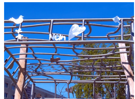
Detail am Pavillon "Gedeckter Tisch"